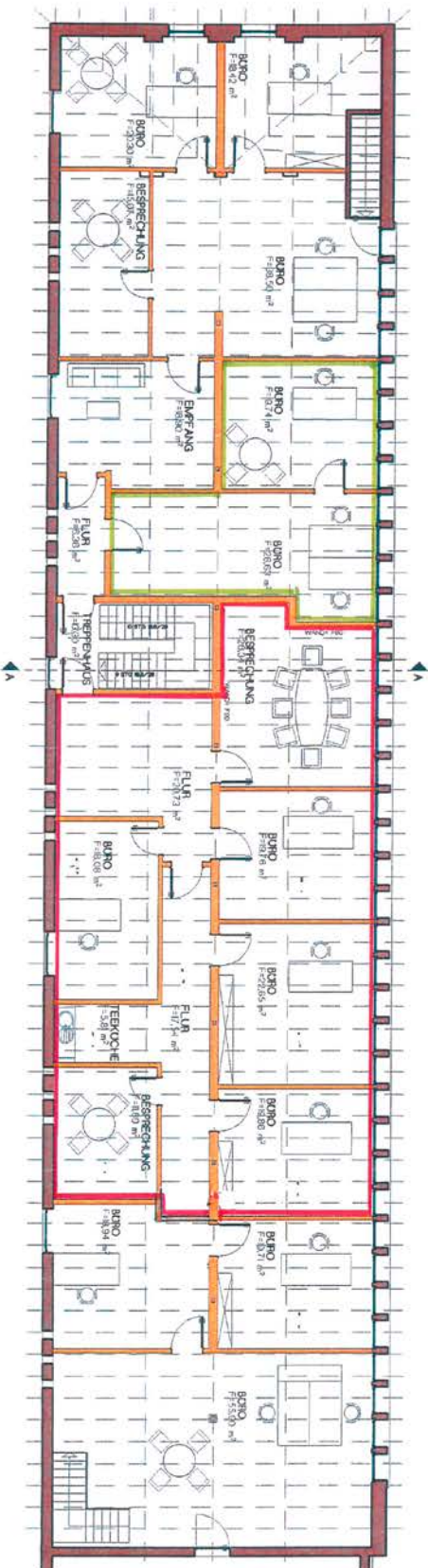
GRUNDRISS EBENE 2